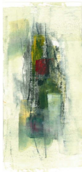
Öl, Graphit auf Papier . 10 x 22 cm . 2021