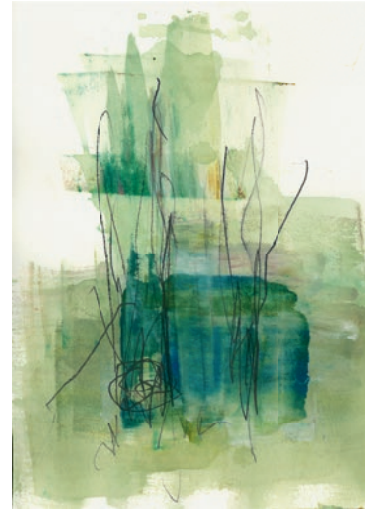
Öl, Graphit auf Papier . 15 x 21 cm . 2021