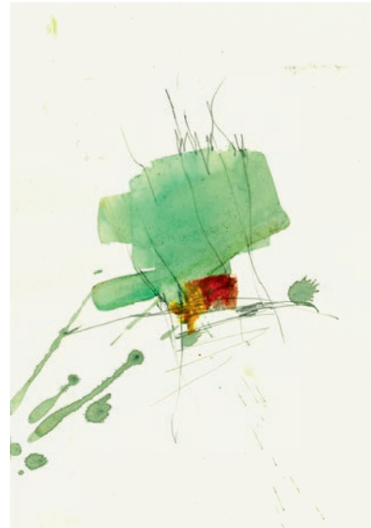
Öl, Graphit auf Papier . 21 x 30 cm . 2021