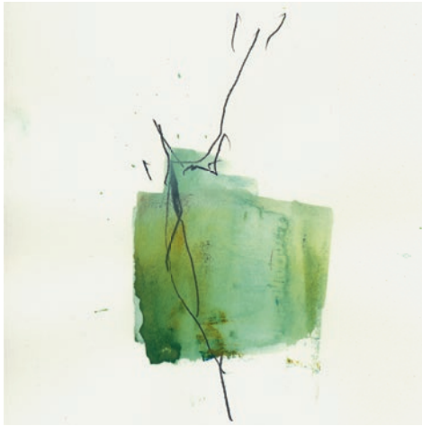
Öl, Graphit auf Papier 15 x 15 cm . 2021