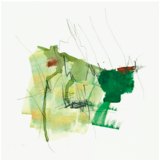
Öl, Graphit auf Papier . 30 x 30 cm . 2021