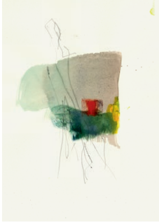
Öl, Graphit auf Papier . 21 x 30 cm . 2021