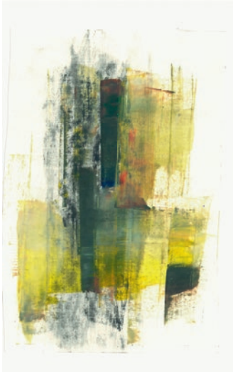
Öl, Graphit auf Papier . 7 x 11 cm . 2021