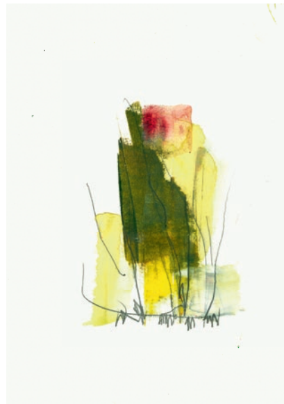
Öl, Graphit auf Papier 15 x 21 cm . 2021