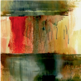
Öl, Graphit auf Papier . 10 x 10 cm . 2021