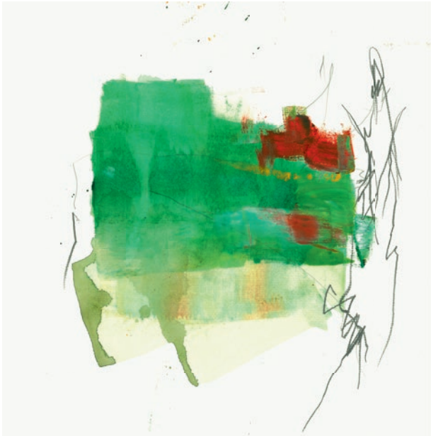
Öl, Graphit auf Papier . 32 x 32 cm . 2021