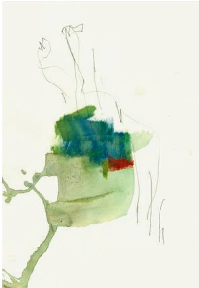
Öl, Graphit auf Papier . 21 x 30 cm . 2021