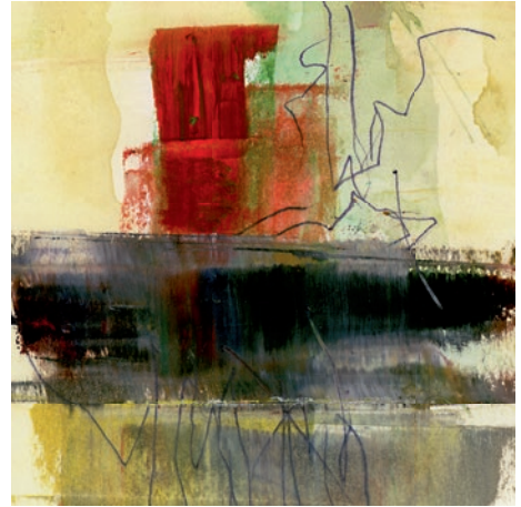
Öl, Graphit auf Papier . 10 x 10 cm . 2021