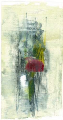
Öl, Graphit auf Papier . 10 x 19 cm . 2021