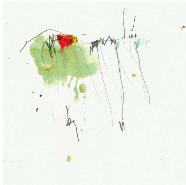
Öl, Graphit auf Papier . 30 x 30 cm . 2021