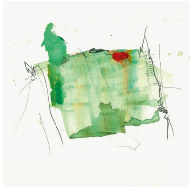
Öl, Graphit auf Papier . 32 x 32 cm . 2021