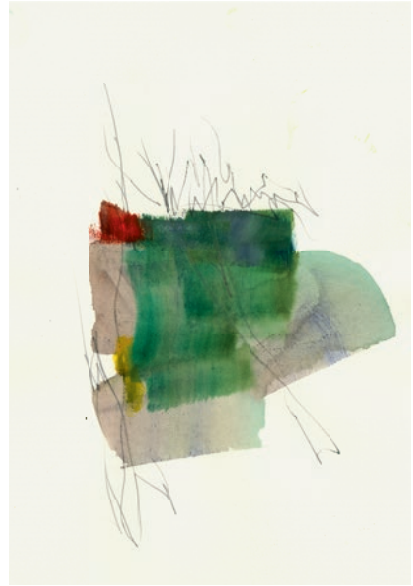
Öl, Graphit auf Papier . 21 x 30 cm . 2021