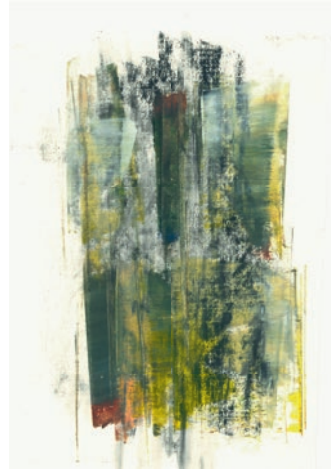
Öl, Graphit auf Papier . 7 x 11 cm . 2021