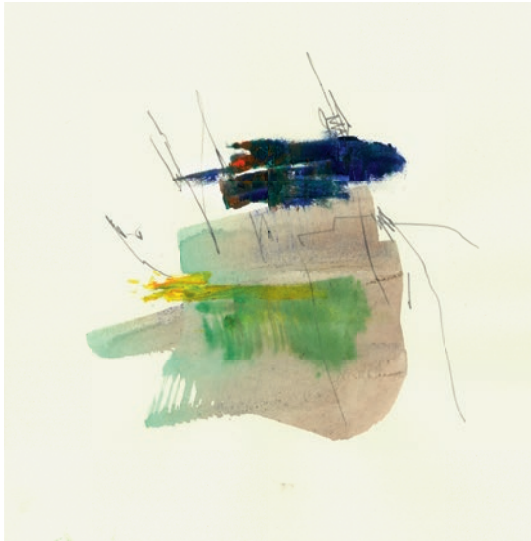
Öl, Graphit auf Papier . 21 x 21 cm . 2021