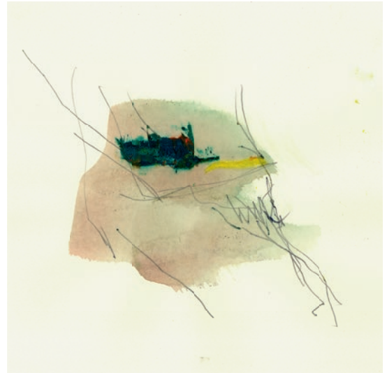
Öl, Graphit auf Papier . 21 x 21 cm . 2021