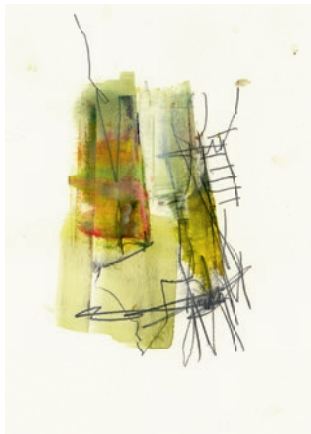
Öl, Graphit auf Papier 15 x 21 cm . 2021