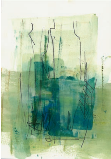
Öl, Graphit auf Papier . 15 x 21 cm . 2021