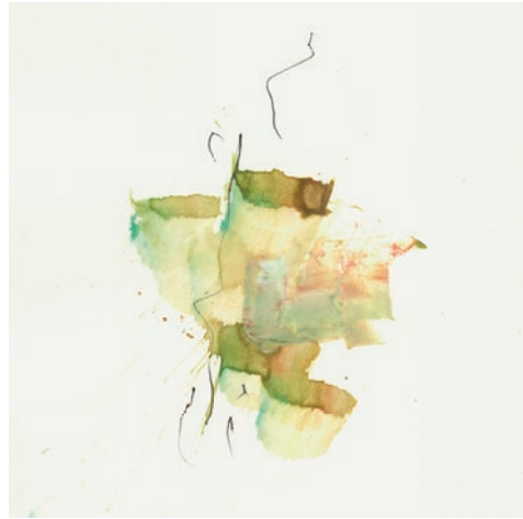
Öl, Graphit auf Papier 15 x 15 cm . 2021